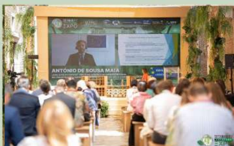
PERCORSO NEGLI SDGs DELL'AGENDA ONU 2030