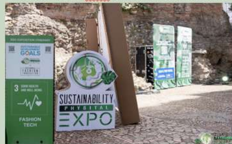
SFILATA NARRATA® NEI FORI IMPERIALI