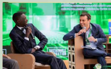
CENA NETWORKING B2B e B2G