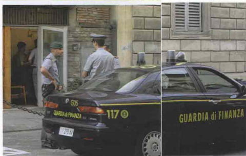
L'OPERAZIONE DELLE FIAMME GIALLE. IN ALTO: UNA COLTIVAZIONE DI GIRASOLE

Ritaglio stampa ad uso esclusivo del destinatario, non riproducibile.