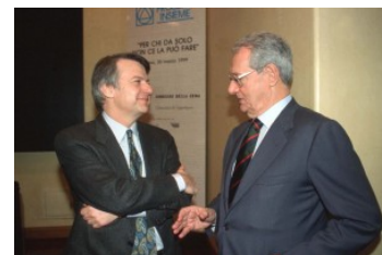
Gli incontri in Italia di Marion Le Pen (che abbandona la politica). Le foto