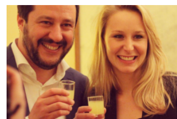
Chi c'era all'inaugurazione della sede Dia a Milano. Le foto